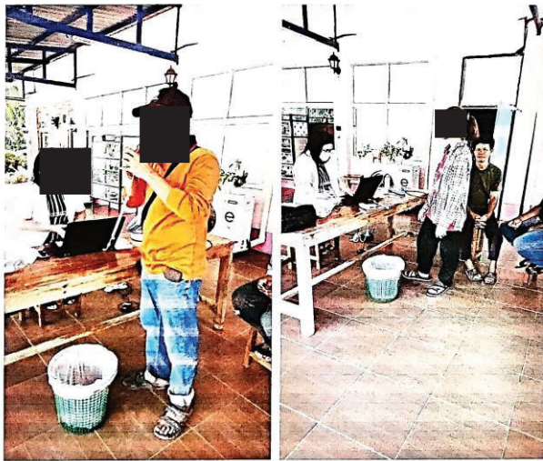
ภาพตรวจสอบภาพ กองทุนเพื่อระงับสุขภาพ ประจำปี 2567 ประทานบัตรเลขที่ 20845/16274